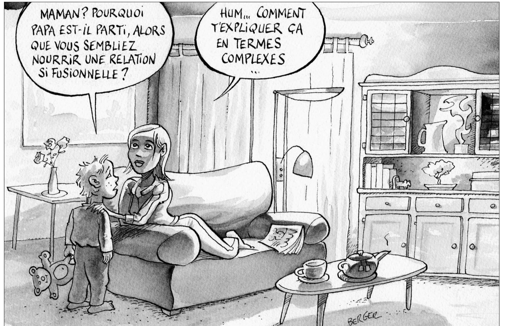
Selon Olivier Revol, «les HP ont toujours des préoccupations intellectuelles qui les mettent en décalage par rapport aux autres».

C'est un enfant qui a des compétences intellectuelles supérieures à celles des enfants de son âge. Voilà pour la définition classique, qui fait référence à un quotient intellectuel (QI) qu'on estime supérieur à 130, sachant que le QI normal se situe entre 85 et 110. Cette définition est réductrice, car le haut potentiel ne se résume pas à un QI. D'autant plus que le QI est un cliché de ce que l'enfant a bien voulu montrer lors du test.